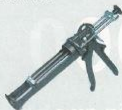
PP1 Patronpistol Art. nr. 200 14M 020 RSK 3830040