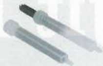
FP504 Mixerrör Art. nr. 200 14M 019 RSK 3830041