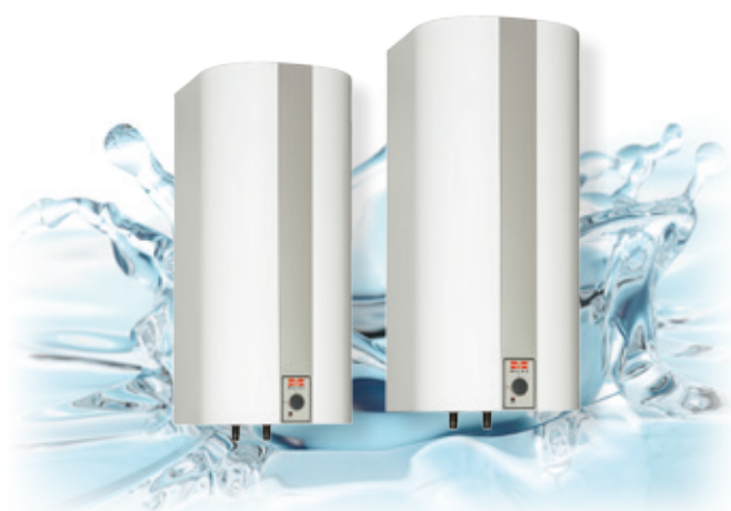
METRO ZENIT RST 60 ja 110 litraa

Rst-varaajien säiliö on ruostumatonta erikoisterästä. Emali-varaajien säiliö on emaloitua terästä ja vastus suojaaputkessa. Suoja-anodin ansiosta emaloitua varaajat soveltuvat erityisesti kalkkisiin sekä suolaisiin vesiin.