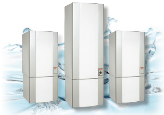
METRO MODUL RST 200 ja 300 litraa